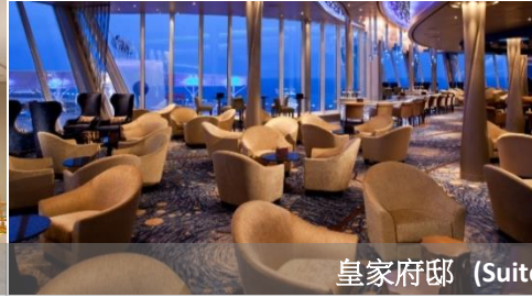
皇家府邸 (Suite Neighborhood)