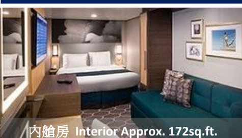
內艙房 Interior Approx. 172sq.ft.