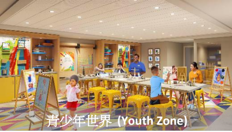
青少年世界 (Youth Zone)