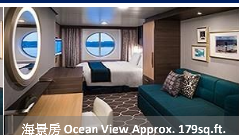
海景房 Ocean View Approx. 179sq.ft.