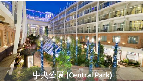
中央公園 (Central Park)

感受非一般的亞洲 - 立即登上皇家家勒比最大的遊輪，展開您的亞洲之旅。海洋奇蹟號為全球最大型的遊輪，同時是同類型中設有八大主題園區的首架遊輪，每一層甲板都滿載驚喜 — 像是海上最長的滑梯「終極深淵」、海上劇院令人一看難忘的表演，以及能滿足味蕾的世界級用餐體驗，展開你的非凡遊輪之旅。