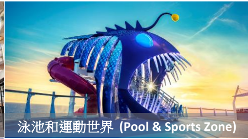
泳池和運動世界 (Pool & Sports Zone)