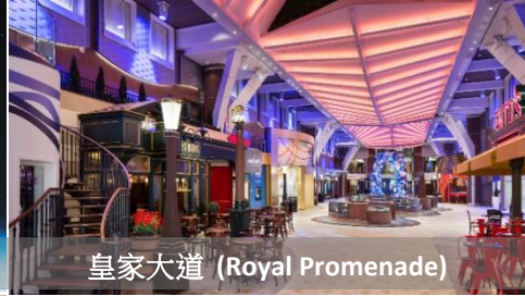
皇家大道 (Royal Promenade)