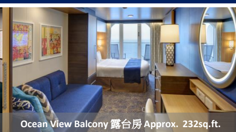
Ocean View Balcony 露台房 Approx. 232sq.ft.