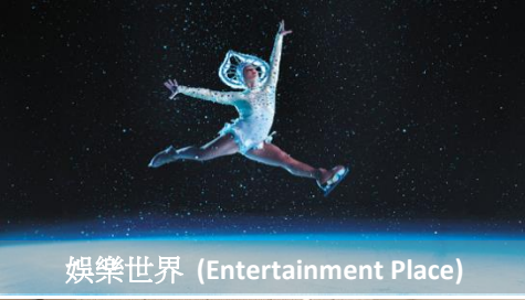
娛樂世界 (Entertainment Place)