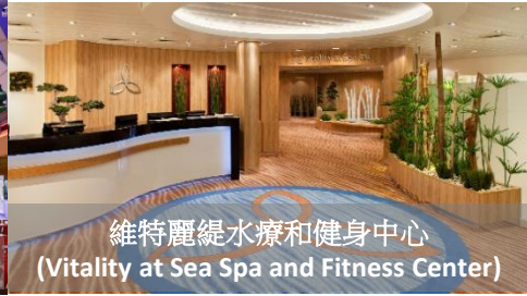
維特麗緹水療和健身中心 (Vitality at Sea Spa and Fitness Center)