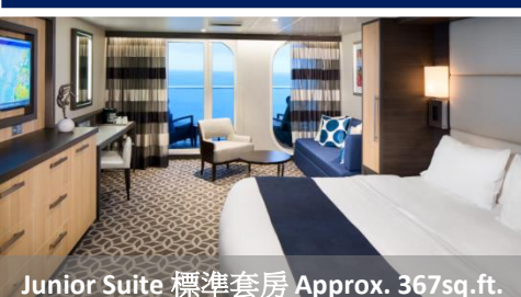
Junior Suite 標準套房 Approx. 367sq.ft.